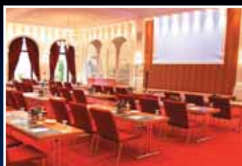
Professionell tagen ...

Dies alles ist „Confertainment“ im Europa-Park: eine professionelle Mischung von modernem Tagungsmanagement mit motivierenden Unterhaltungselementen – Tagung und Entertainment auf höchstem Niveau.