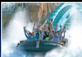
... Spaß haben ...