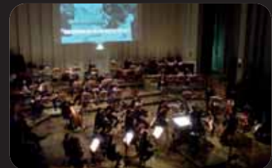
Ohne Geigen küsst man nicht ...