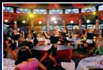
... den Abend genießen ...