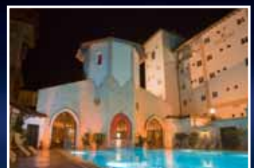
und traumhaft übernachten.