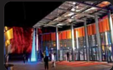
Metropolis Halle® 3.038 m² Studio 1.000 m² lichtdurchflutetes Foyer Kongresse, Präsentationen, Galas, Messen